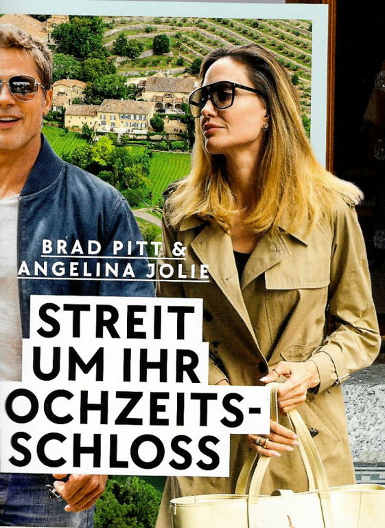
BRAD PITT & ANGELINA JOLIE